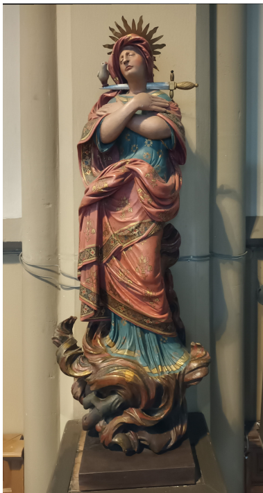
H. Lucia achttiende eeuw